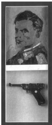
Retrato de Stauffenberg, s/f, 73 x 31,3 x 8 cm. Tomado de Los días de Alberto Croneola, Museo de la Ciudad de México-Tec de Monterrey, México, 2000.